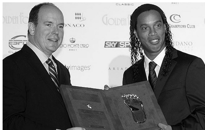
O meio-campista Ronaldinho Gaúcho recebeu o prêmio das mãos do Príncipe Albert II, de Mônaco

Ronaldinho Gaúcho recebeu o Prêmio Golden Foot de 2009, que celebra a carreira e não a fase dos jogadores, com no mínimo 28 anos. O Prêmio foi concebido ao craque pelo Príncipe Albert II, de Mônaco, no próprio principado, no último dia 12 de outubro.