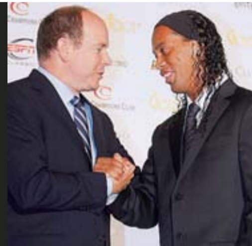
Il principe Alberto II di Monaco con Ronaldinho