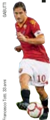
Francesco Totti, 33 anni

«Dipende solo da come starò». La verifica a marzo-aprile